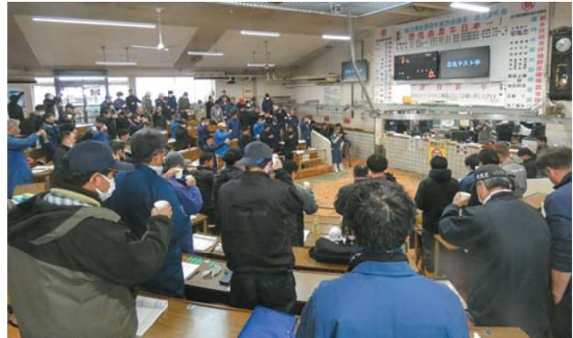
生産者・購買者・消費者へ献杯で敬意を