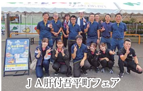
JA肝付吾平町フェア

10月5日(土)おいどん市場与次郎館にて、JA肝付吾平町フェアが開催されました。