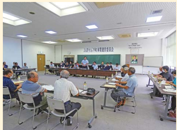
事業運営委員会の会議風景