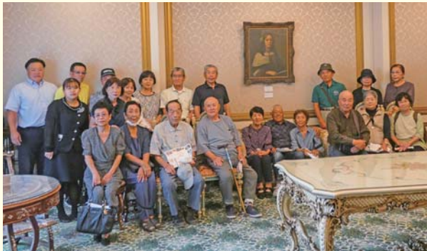
1班参加者の皆さん