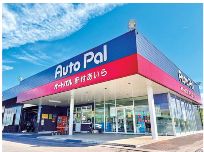
リニューアルオープン