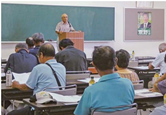
東桂木会長のあいさつ

9月20日、農協2階大ホールにて、J A 肝付吾平町畜産振興会総会が開催されました。