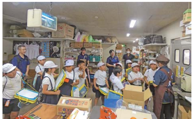
社会見学に目を輝かせていました。