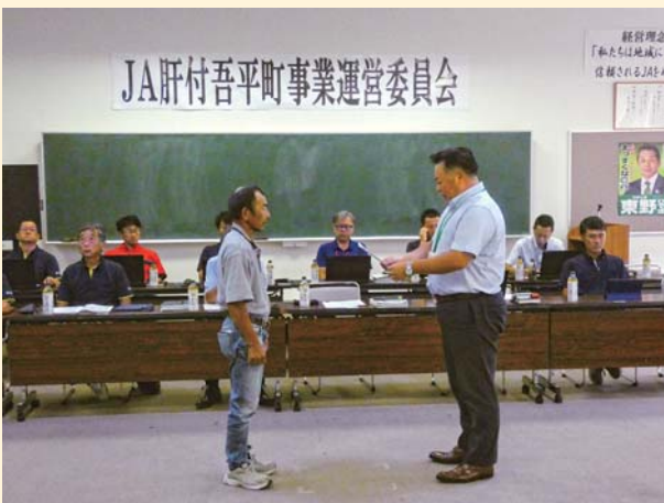
事業運営委員の委嘱状交付式