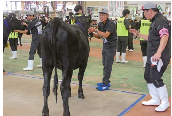
うめひさ号 審査中