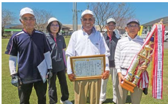
団体優勝：吾平中央町①チーム