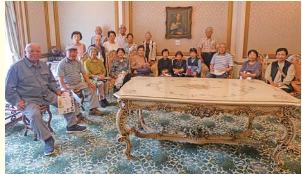
2班参加者の皆さん