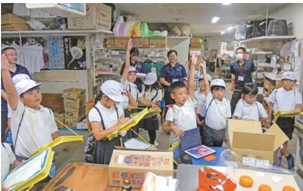
熱心にいっぱい質問を

ぜひ、組合員・地域住民の皆様のさらなるご利用を従業員一同心よりお待ちしております。