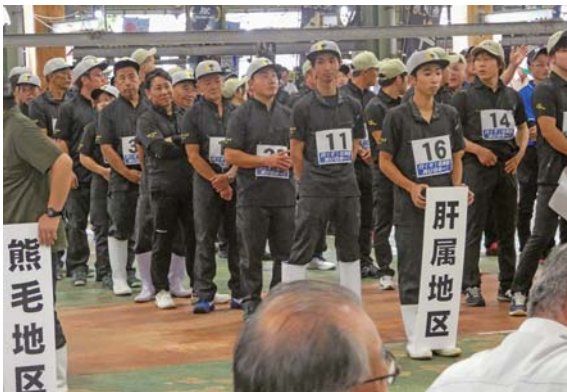
肝属代表出品者の皆さん

当JAとしては、今後も生産者・行政・関係機関と一体となり、3年後の北海道全共をめざして一生懸命頑張っていきたいと思います。